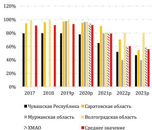
График 2: Показатели захоронения отходов для проектов, управляемых АО «Управление отходами», % захоронения отходов

Плановые показатели 2019-2023.